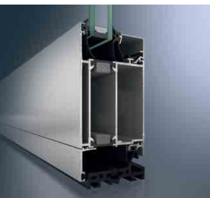
Schüco Tür ADS 70 HD Schüco door ADS 70 HD