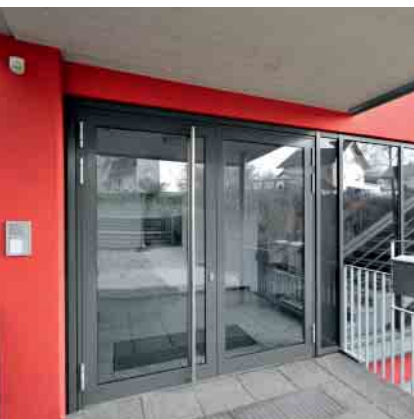
Schüco Aluminium-Türsystem ADS 70 HD Schüco Aluminium door system ADS 70 HD